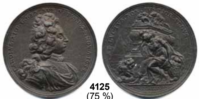
4125 (75 %)