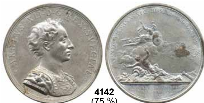
4142 (75 %)