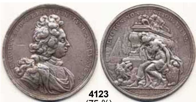
4123 (75 %)