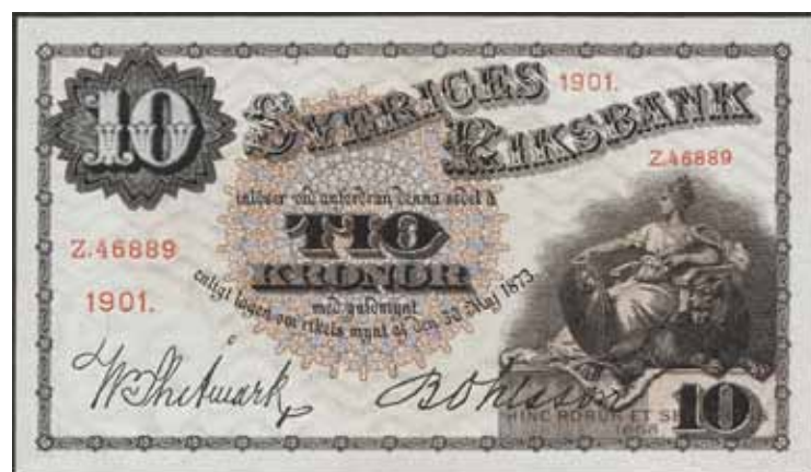
4644 SF R3b 11 10 kronor 1901. Z.46889. Ett av de bäst bevarade exemplaren.