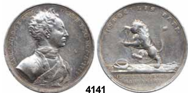
4141 (75 %)