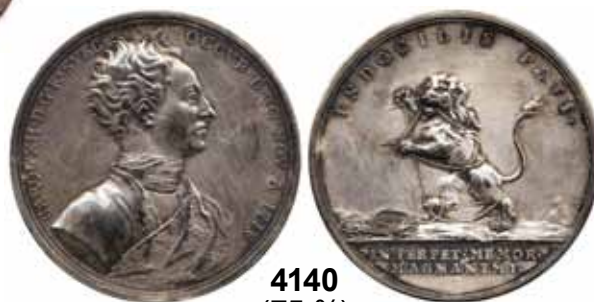
4140 (75 %)