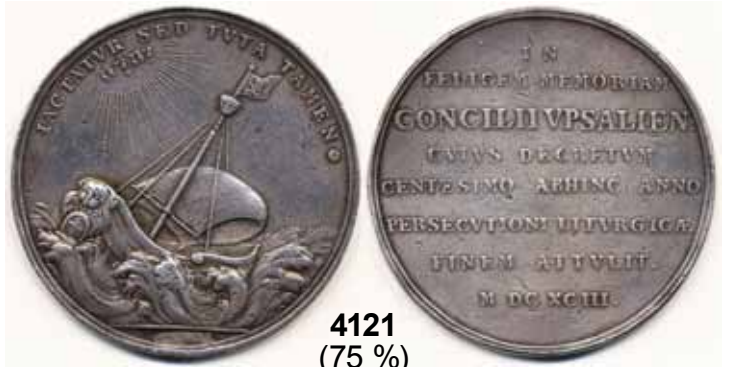
4121 (75 %)