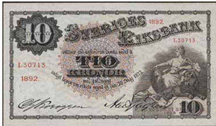
4642 SF R3a 1 10 kronor 1892. I.30713. Pressad, spår av mittveck. Gemavtryck på baksidan. Ett av de bäst bevarade exemplaren.