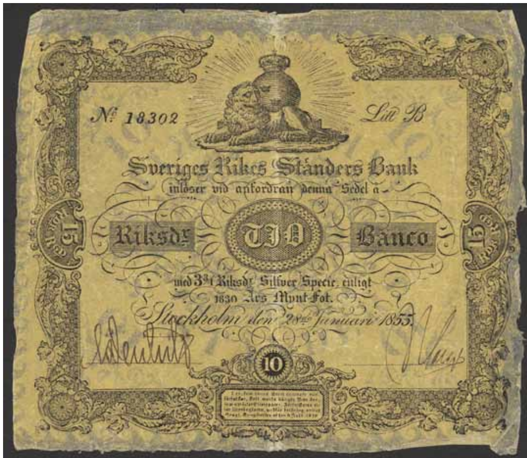
4491 SF D2 6 10 riksdaler banco 1855. No 18302 Litt B. Fräsch sedel, endast mittvikt. Spegeltryck av sedeln på baksidan!