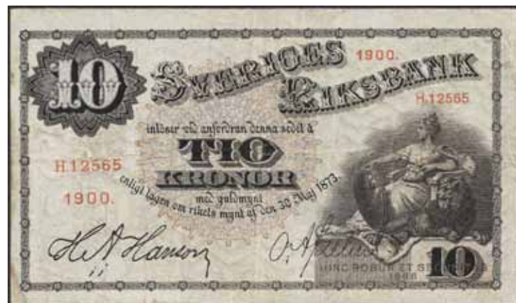
4643 SF R3b 10 10 kronor 1900. H.12565. Sällsynt år. Inga riss eller defekter.