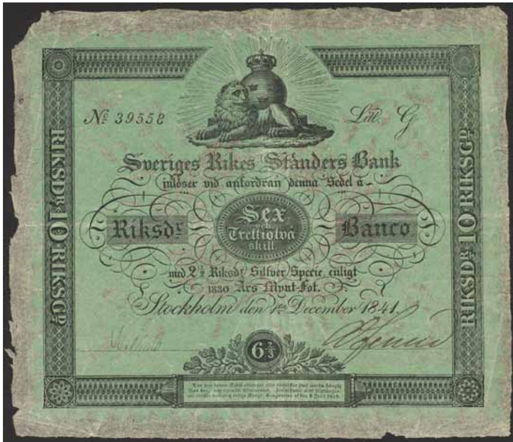
4492 SF C2 1 6 2/3 riksdaler banco 1841. Sällsynt sedel i god kvalitet utan riss eller anmärkningar.