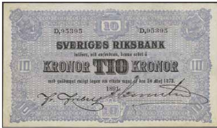
4641 SF R2 12 10 kronor 1891. D.95395. Ocirkulerat toppexemplar.