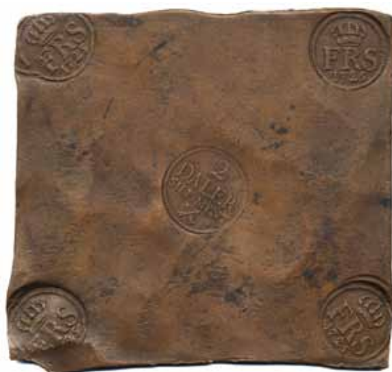
104 40 %

103 SM 189 4 daler silvermynt 1726. 3013 g. Plåtmynt.