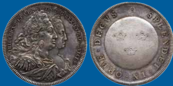
102 SM 179 1 riksdaler U. år. 29,81 g. Reseriksdaler till besök i Hessen. Ovanlig. Mycket vacker lyster.