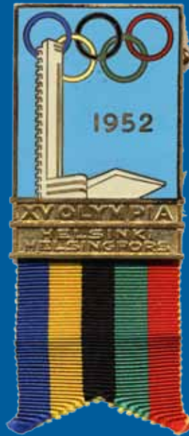
619 Finland Olympic Games Helsinki 1952. Enameled badge (32×48 mm), for participating officer, with ribbon (C.I.O. ribbon missing). Extremely rare!