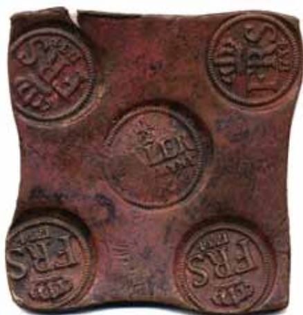
105 60 %