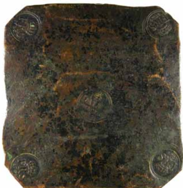
103 40 %